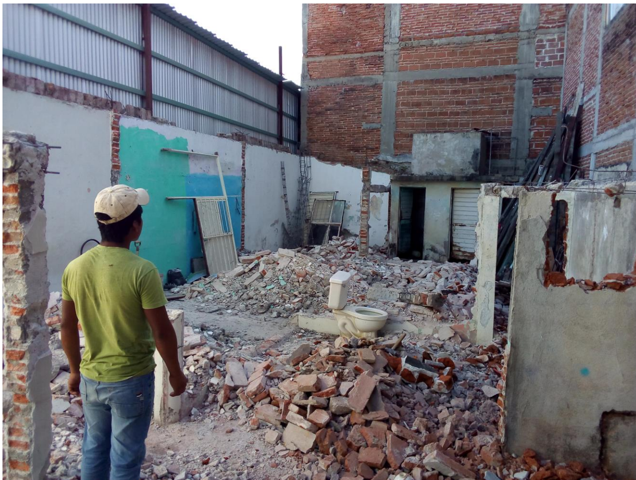
Fotografía de los avances realizados